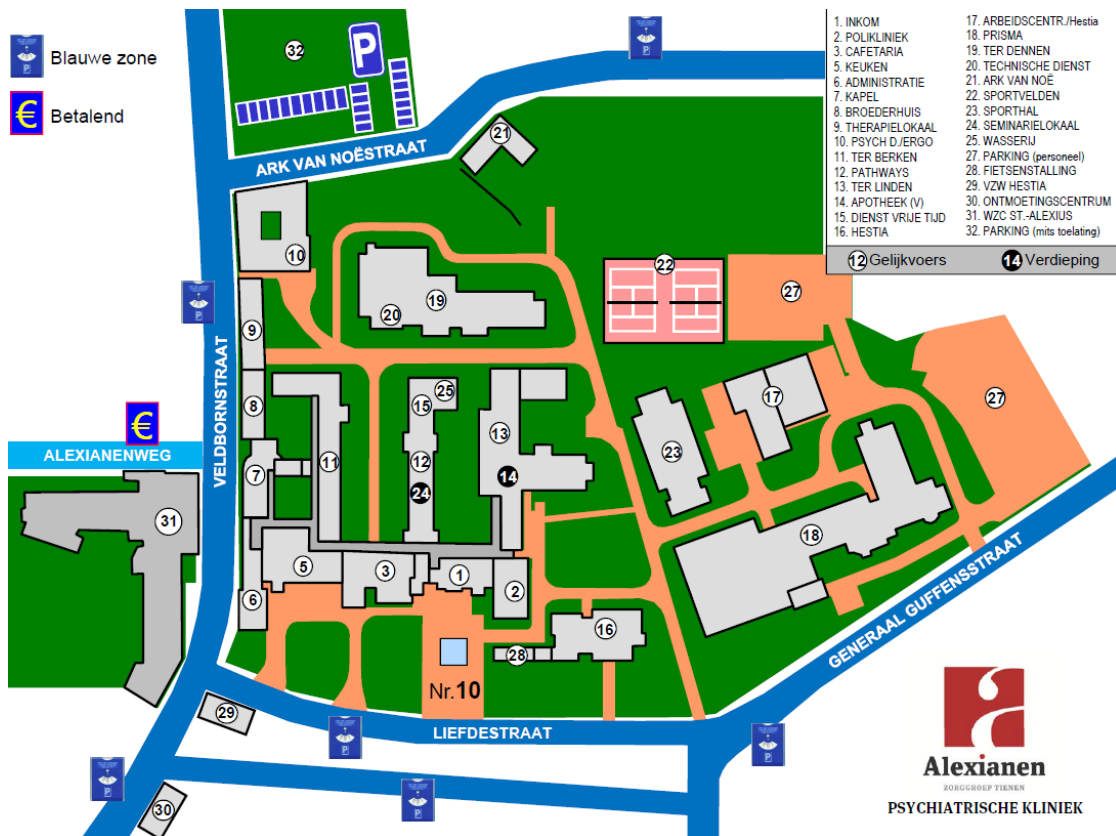
Figuur 2: Parkeerplaatsen met parkeerschijf en betaalparking in de Alexianenweg.