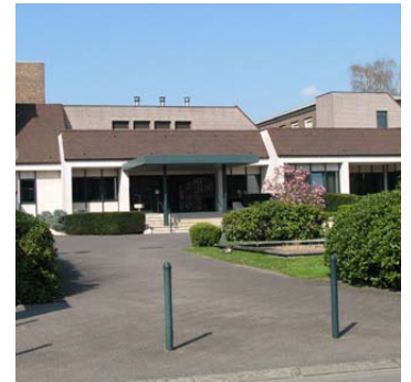
Ingang van de kliniek Liefdestraat 10